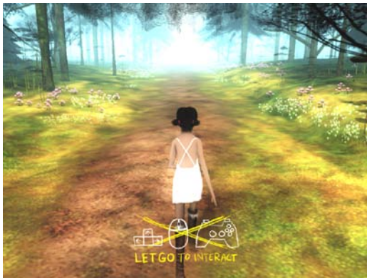
The Path: Der gerade Weg

Großmutter's Haus. Wie viele Räume des Hauses zugänglich werden, hängt von der Abenteuerlust und Unerschrockenheit der Spieler ab. Nur durch das eigentlich streng verbotene Abweichen vom vorgeschriebenen direkten Weg ("Stay on the path!") kann man nämlich Blumen sammeln, dem Wolf begegnen und bestimmte Orte aufsuchen, was, wie die gadgets in anderen Spielen, Gutpunkte bedeutet. Abenteuerlust bzw. der Versuchung nachgeben und sich über die Autorität und Vernunft der Erwachsenen hinwegsetzen macht das Leben bunter.